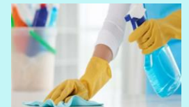
Desinfectar la superficie