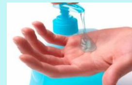
Disponer de gel alcoholada