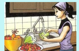
Lavar los alimentos

La mejor prevención es “Quédate en casa”