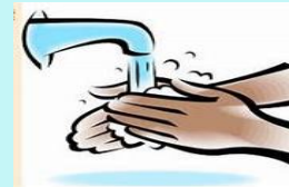
Higiene de manos