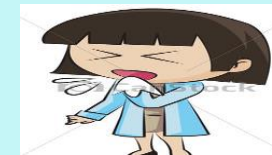
Cubrir la nariz y la boca