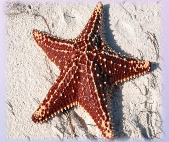
La Estrella de mar