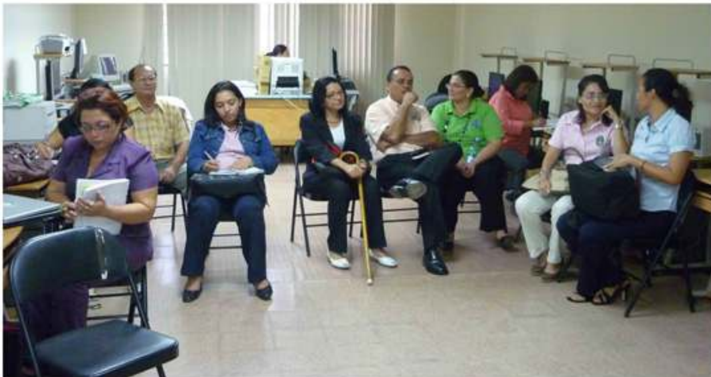
Gira de Trabajo en la provincia de Herrera.

De las investigaciones presentadas en este encuentro algunas fueron solicitadas para capacitación durante el verano 2010 y otras participaron de concursos para pasantías y fueron elegidas para ser expuestas en el exterior.