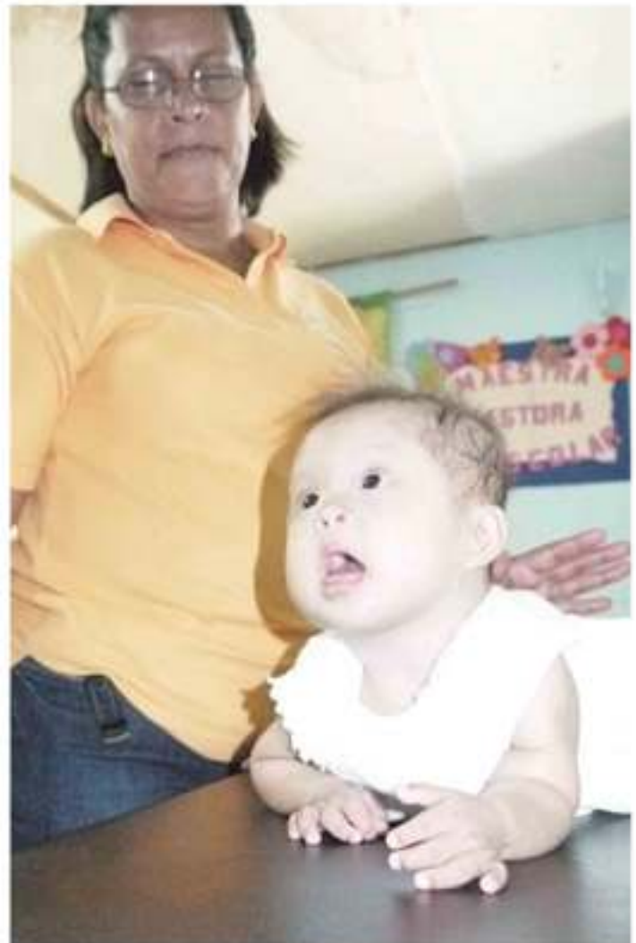
• Estimulación Temprana

En cierta ocasión los discípulos de Jesús le preguntaron respecto a un joven que había nacido ciego: Rabi, ¿quién PECÓ, éste o sus padres, para que haya nacido ciego? Respondió Jesús: No es que pecó éste, ni sus padres, sino para que las obras de Dios se manifiesten en él.