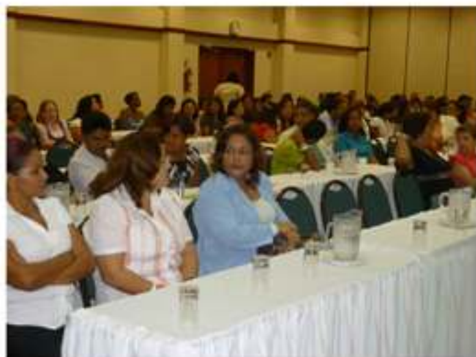
III Encuentro Nacional de Investigadores