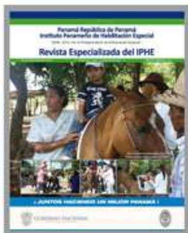
Portada Revista Especializada del IPHE