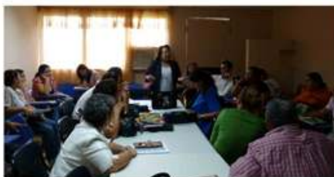
Reunión de Trabajo de Investigaciones en Veraguas.

En el año 2010 con el objetivo de capacitar a los funcionarios investigadores se realizan jornadas sobre "Estadística para la Investigación" ofreciendo herramientas importantes para la presentación de los resultados de las investigaciones. De la misma manera hemos realizado la divulgación a nivel nacional donde presentamos a las autoridades de cada provincia y a toda la comunidad educativa en general las investigaciones hechas en cada región, presentando así el trabajo hecho a nivel de investigación, lo que demuestra que la cultura investigativa de los/as funcionarios/as en esta institución cada vez está más fortalecida, por lo que vemos el incremento en las personas que desean investigar por una sola causa mejorarles la calidad de vida y de los aprendizajes de los niños, niñas y jóvenes con discapacidad.