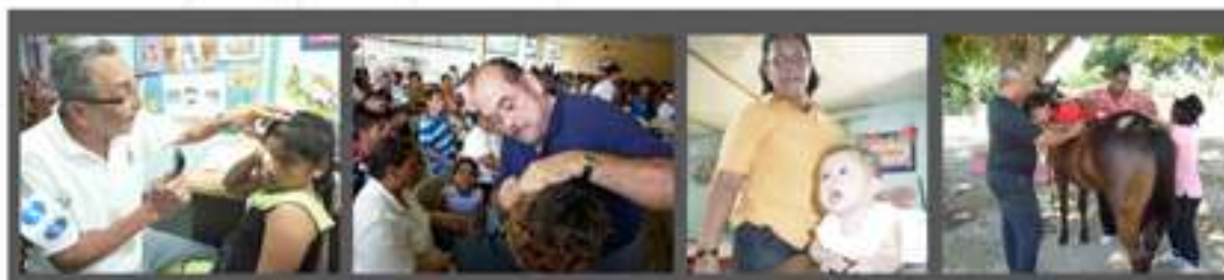
• Atención Oftalmológica