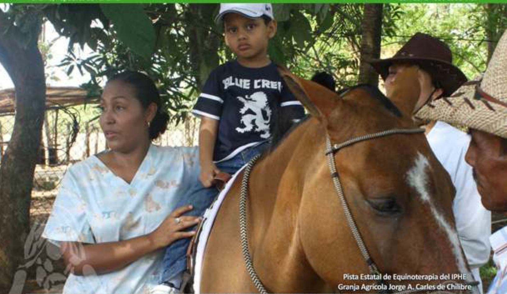
Pista Estatal de Equinoterapia del IPHE Granja Agrícola Jorge A. Carles de Chilibre