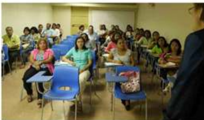
Autismo en Herrera.